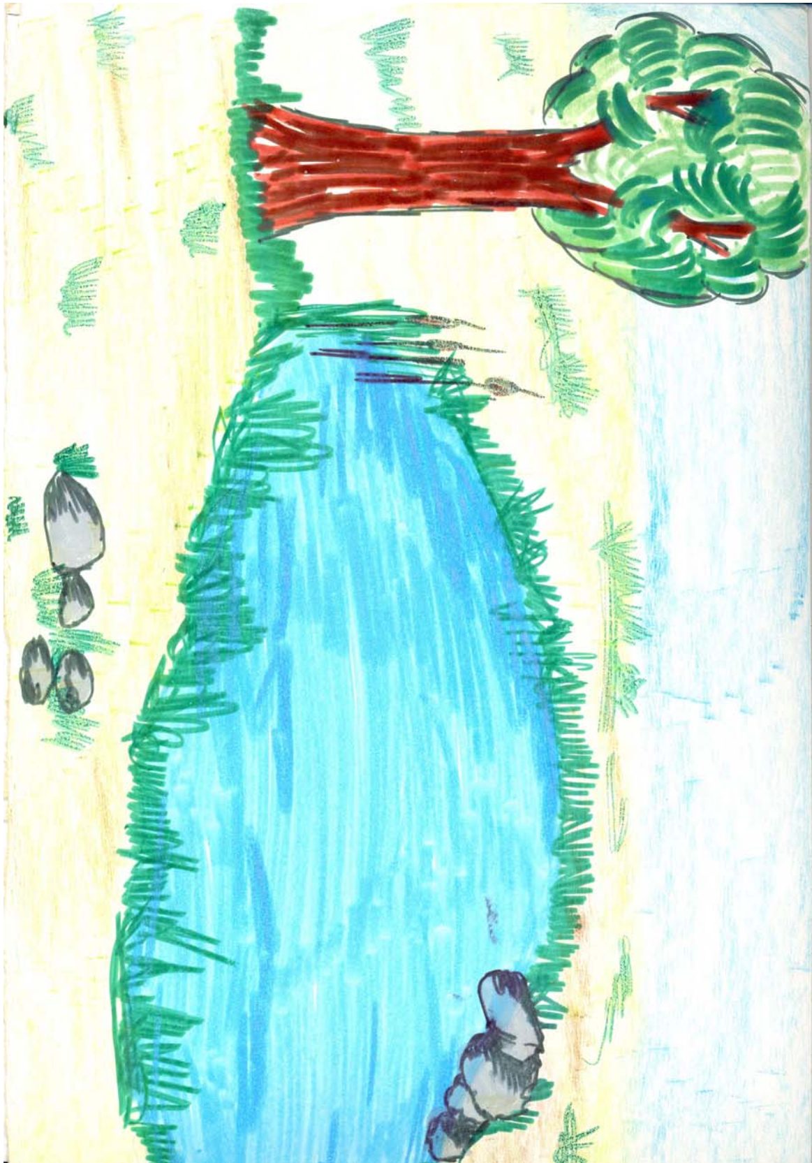
Attività: descrizione di un'immagine 2 – Disegno da completare