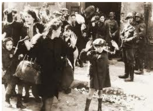
Arresto di ebrei

Recentemente, è stata trovata in un archivio l'ultima copia di un documento che contiene il verbale di una riunione, tenutasi a Berlino nel 1942, fra alti funzionari e ufficiali nazisti, nella quale fu deciso e organizzato con precisione e metodi "industriali", lo sterminio (genocidio) del popolo ebraico. Si parlò di SOLUZIONE FINALE.