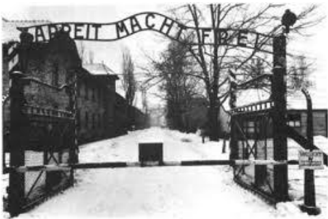
Ingresso ad Auschwitz

E' il giorno in cui, nel 1945, ormai alla fine della guerra, le truppe Sovietiche (della Russia e di altre nazioni confederate con essa), in marcia verso Berlino, scoprirono ad Auschwitz il più grande lager costruito dai nazisti e ne liberarono i pochi prigionieri rimasti. Altri, a migliaia, all'avvicinarsi dell'esercito Sovietico, erano stati costretti dai nazisti a seguirli nella loro ritirata precipitosa. Essi tentavano così di nascondere i crimini di cui si erano macchiati. Moltissimi prigionieri morirono o furono uccisi durante questa terribile marcia.