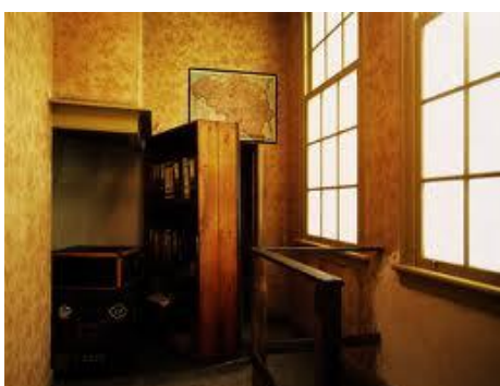
lo scaffale che mascherava l'ingresso

Lì la famiglia stette per due lunghi anni, dividendo il minuscolo spazio con altre quattro persone, anche loro ebrei, facendo ben attenzione a non farsi sentire o vedere dall'esterno, senza poter uscire mai, né di giorno, né di notte.