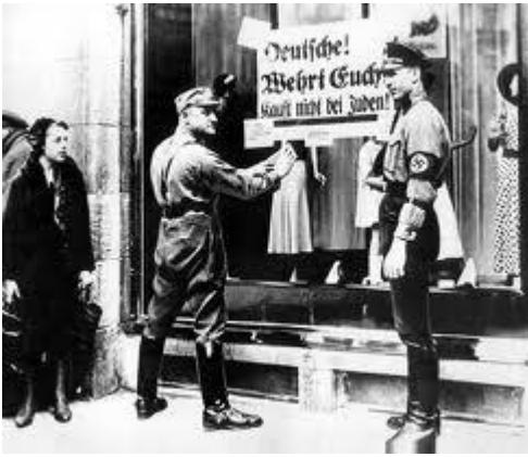
divieto di ingresso agli ebrei