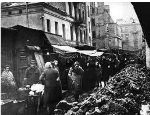
Ghetto di Varsavia

In ogni caso, dal ghetto si usciva solo per essere avviati ai campi di lavoro forzato e di sterminio.