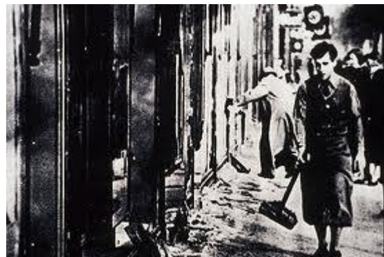
Distruzioni di negozi ebraici