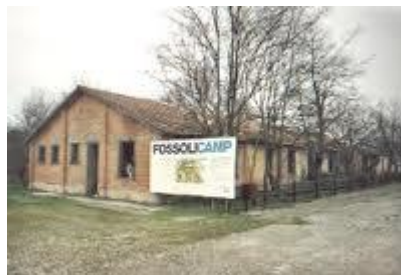
il campo di Fossoli

Nel libro racconta di come, partito da Fossoli (vicino a Carpi, in provincia di Modena), campo dove venivano concentrati gli ebrei, per essere mandati ad Auschwitz, sopravvisse alle terribili condizioni di vita nel lager per la sua conoscenza del tedesco (molto importante per capire subito ciò che i guardiani ordinavano e quello che avveniva) e della chimica, che gli permise di essere mandato a lavorare in una fabbrica per la produzione di gomma sintetica.