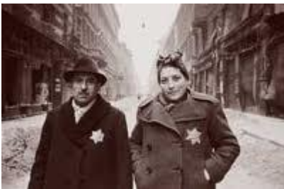
la stella gialla

Erano costretti a portare sempre bene in vista sugli abiti una vistosa stella gialla a sei punte (la stella di David) per essere sempre riconosciuti e identificati come ebrei.