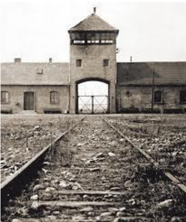
le rotaie verso il campo

Da quel momento, tutto il mondo seppe con certezza quale tragedia fosse avvenuta, contemporaneamente all'altra grande tragedia, costituita dalla guerra.