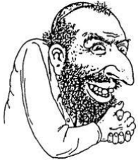
disegno che diffamava gli ebrei

Gli ebrei furono perseguitati in tutti questi paesi, costretti ad abbandonare le loro case, il lavoro, le loro ricchezze. Venivano accusati di essere la causa della povertà della Germania dopo la fine della prima Guerra mondiale e venivano rappresentati come malvagi, disonesti, traditori e perfino orribili d'aspetto.