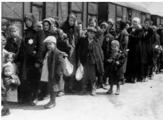
Arrivo ad Auschwitz

Venivano disumanizzati, trasformati in "cose" e come tali percepiti e trattati dai loro aguzzini. Questi non sentivano di aver a che fare con uomini, donne o bambini, non si lasciavano toccare dalle loro sofferenze, ma li trattavano con l'indifferenza, il distacco e l'efficienza di operai in una grande fabbrica della morte.