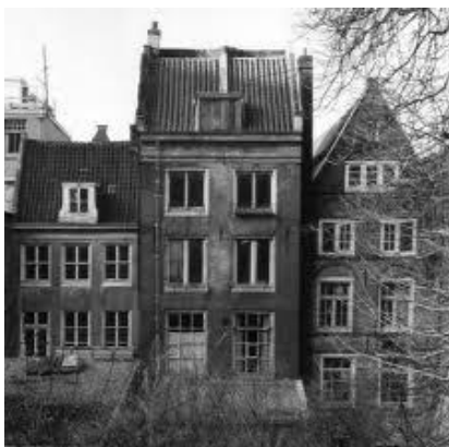
La facciata del rifugio

Ad Amsterdam la famiglia si era ricostruita una vita. Ma quando Hitler invase l'Olanda nel 1940, imponendo anche lì le leggi razziali, i Frank furono costretti a "sparire", nascondendosi in un "rifugio segreto", un piccolo "appartamento" su due piani, posto sopra la sede della ditta di papà Otto, ben nascosto e irraggiungibile da chi non ne conoscesse l'ingresso, coperto da uno scaffale d'ufficio.